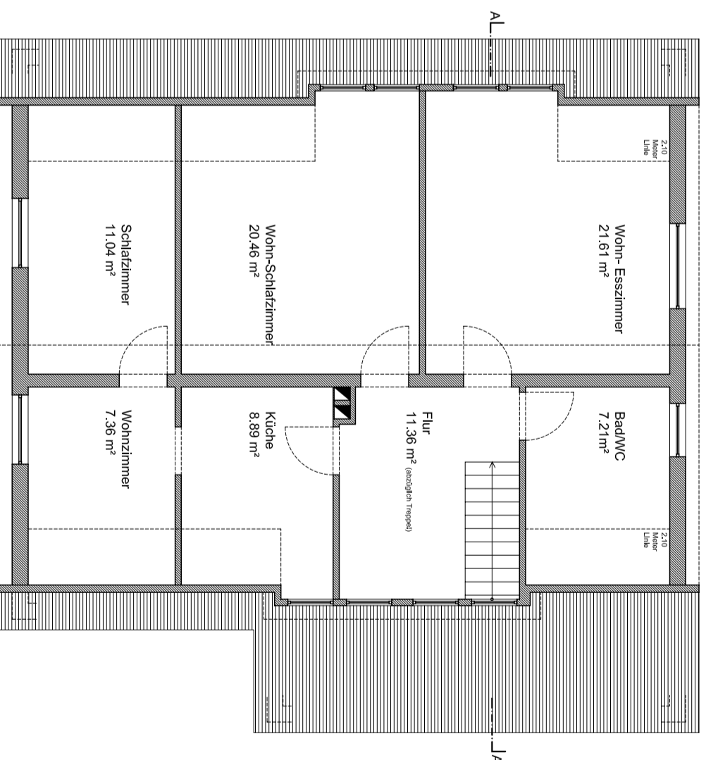
Grundriss Dachgeschoss Gesamt 87,93 m² (abzüglich Schräge, bis 2,10 Meter Linie)